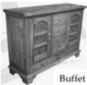
Buffet grandi y chikito